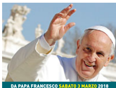
DA PAPA FRANCESCO SABATO 3 MARZO 2018